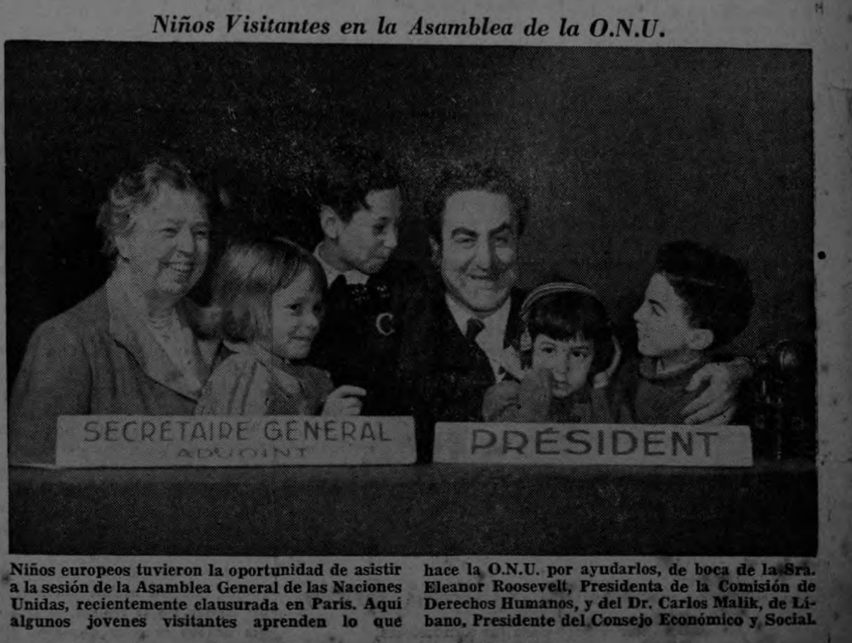
Niños europeos tuvieron la oportunidad de asistir a la sesión de la Asamblea General de las Naciones Unidas, recientemente clausurada en París. Aquí algunos jóvenes visitantes aprenden lo que hace la O.N.U. por ayudarlos, de boca de la Sra. Eleanor Roosevelt, Presidenta de la Comisión de Derechos Humanos, y del Dr. Carlos Malik, de Líbano, Presidente del Consejo Económico y Social.

Se contagia por el aire, las gotitas de secreciones y los esputos ex... —Pasa a la Pág. OCHO